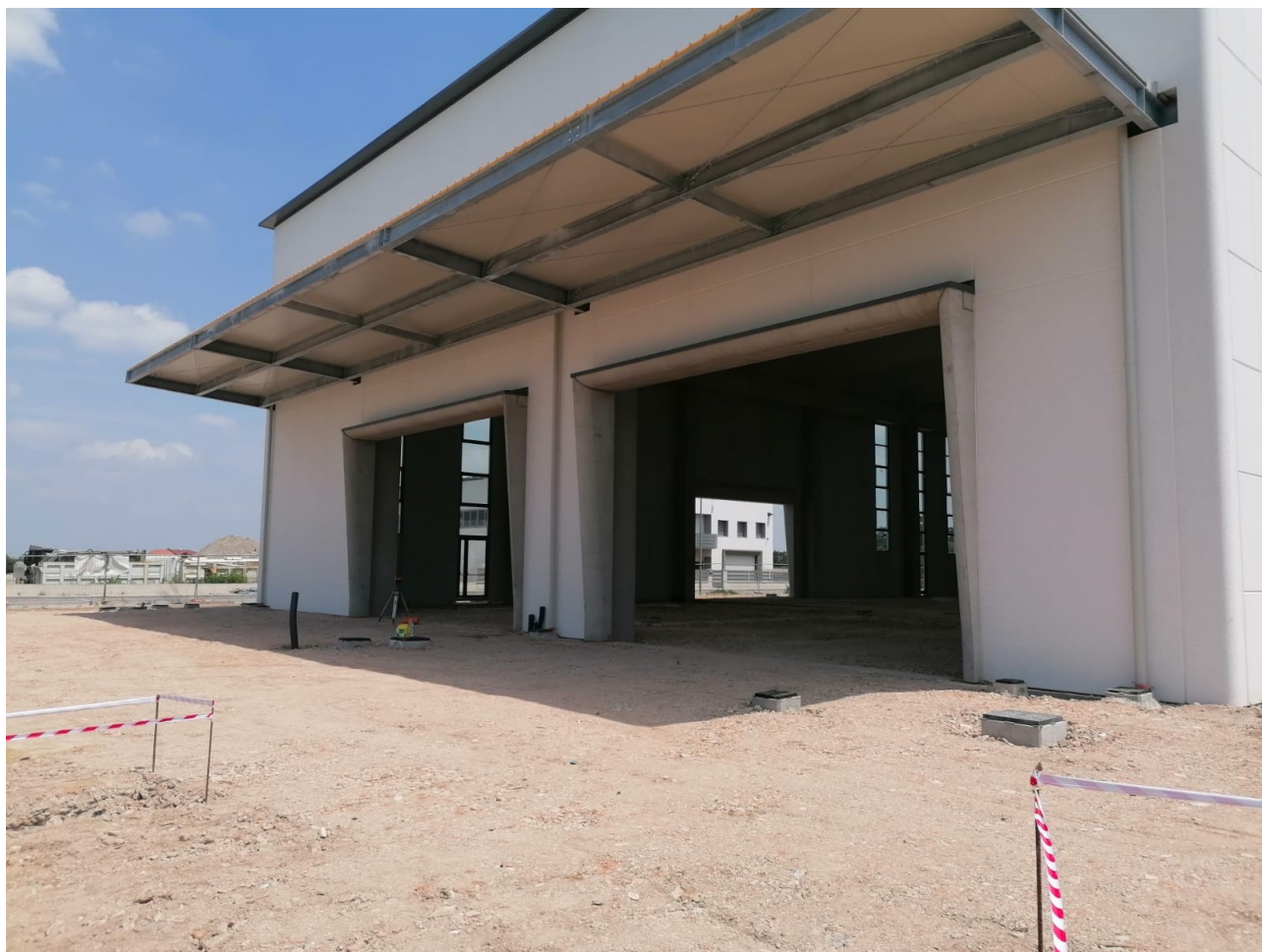
Figura 5: Foto 4