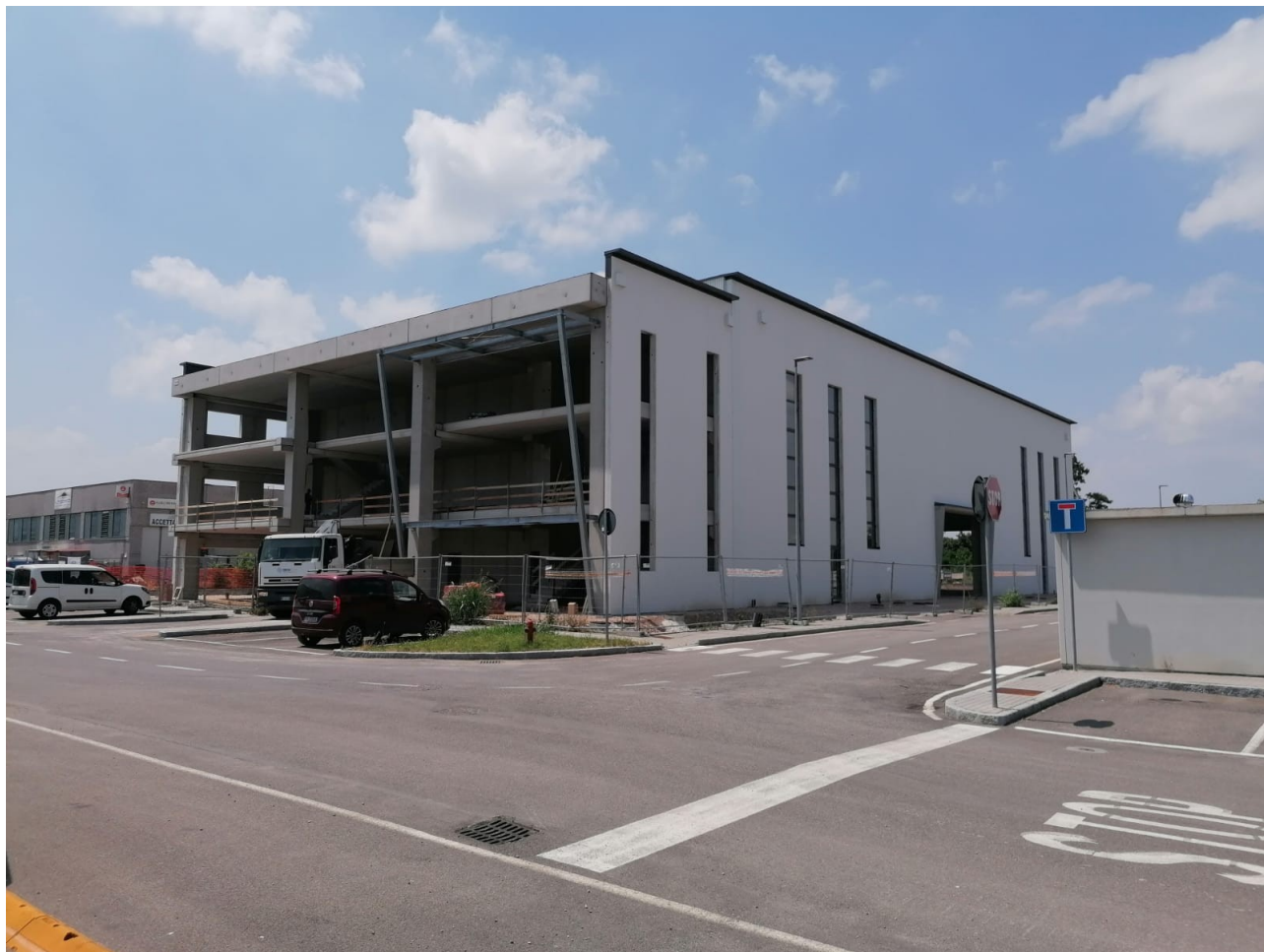
Figura 6: Foto 5