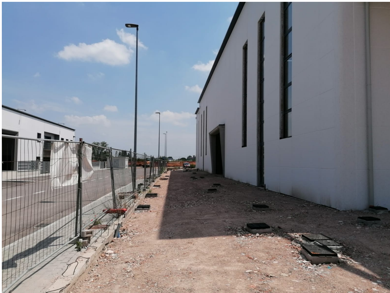
Figura 4: Foto 3