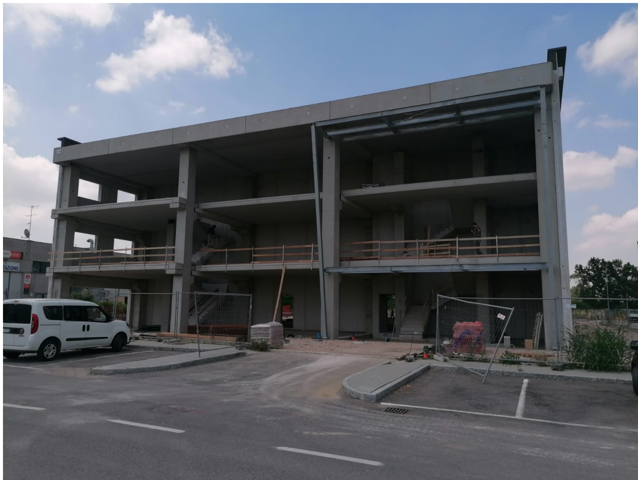
Figura 2: foto 1