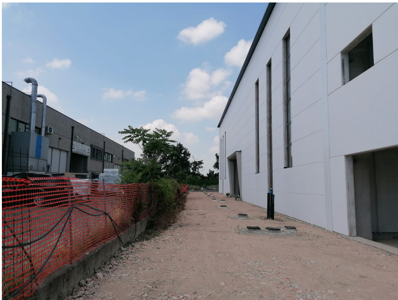
Figura 3: foto 2