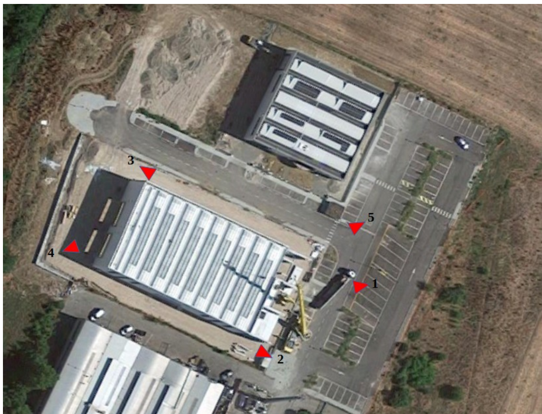
Figura 1: Punti di vista